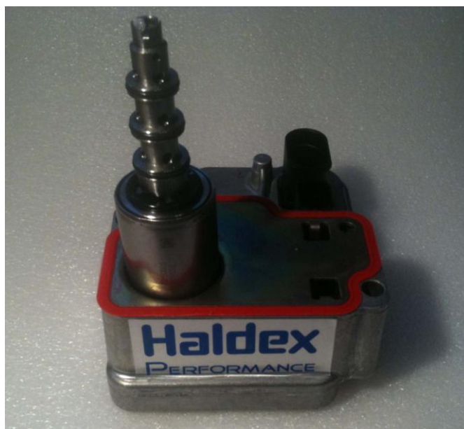
Αναβαθμισμένος controller για αυτοκίνητα εξοπλισμένα με: Haldex gen 4.